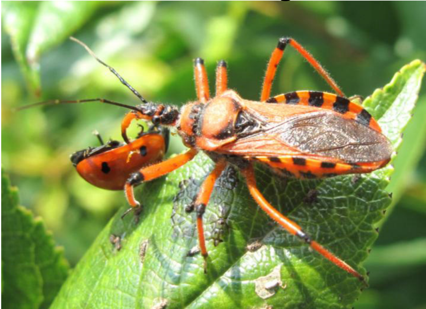
Rhinocorus iracundus dévorant Coccinella septempunctata